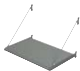
SYSTÈME DE CADRES PRÉASSEMBLÉS BS 100