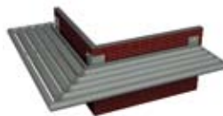
SYSTÈME DE CHÂSSIS BS 30