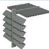
SYSTÈME BS 100 À LAMES FIXES