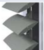
BS 100 AVEC SYSTÈME DE SERRAGE