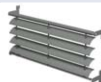
SYSTÈME DE CHÂSSIS BS 20